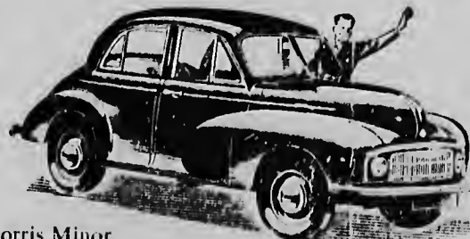
Morris Minor 2-deurs coupé